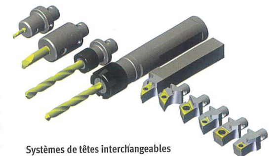
Systèmes de têtes interchangeables pour tours à décolleter SwissMicro.

ser les temps de cycle dus aux différentes configurations possibles. De même pour les tours à décolleter, DT Group propose des carrés de 10 x 10, 12 x 12 et 16 x 16 mm ou queues cylindriques à têtes interchangeables montables sur les peignes et cols de cygne des machines. « Swisstools est très flexible et peut proposer des solu-